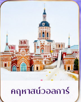
เทศกาลแกะสลักน้ำแข็ง Harbin Ice and Snow Festival