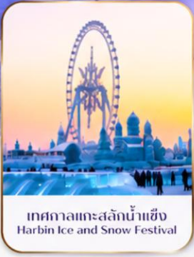
เทศกาลแกะสลักน้ำแข็ง Harbin Ice and Snow Festival