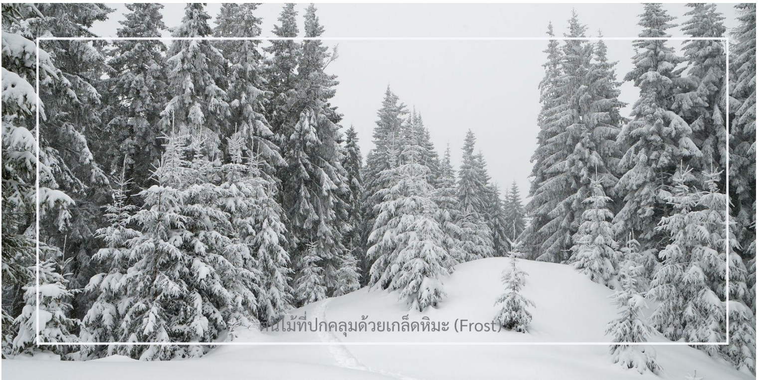
ต้นไม้ที่ปกคลุมด้วยเกล็ดหิมะ (Frost)