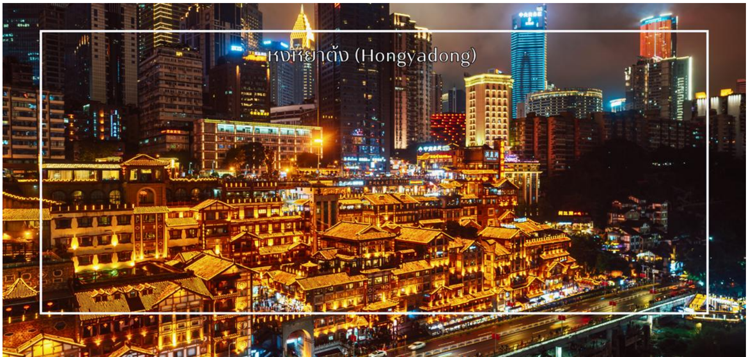
หงหยาดัง (Hongyadong)

สมควรแก่เวลา นำท่านเดินทางสู่ ตลาดหงหยาดัง (Hongyadong) หรือที่เรียกว่า "Hongya Cave" เป็นสถานที่ท่องเที่ยวที่มีชื่อเสียงในเมืองฉงชิ่ง โดยตั้งอยู่ริมแม่น้ำแยงซี มีบรรยากาศที่เต็มไปด้วยวัฒนธรรมและประวัติศาสตร์ ตลาดหงหยาดังเป็นพื้นที่ที่มีอาคารแบบดั้งเดิมที่สร้างขึ้นในสไตล์สถาปัตยกรรมแบบชิโน-ทิเบต โดยมีร้านค้า ร้านอาหาร และบาร์จำนวนมาก ที่นี้ท่านสามารถลิ้มลองอาหารรสเด็ดและชมพื้นเมืองอื่นๆที่ขึ้นชื่อ ตลาดหงหยาดังยังมีวิวทิวทัศน์ที่สวยงาม สามารถเดินเล่นตามทางเดินที่มีการจัดแสดงงานศิลปะและสินค้าท้องถิ่น