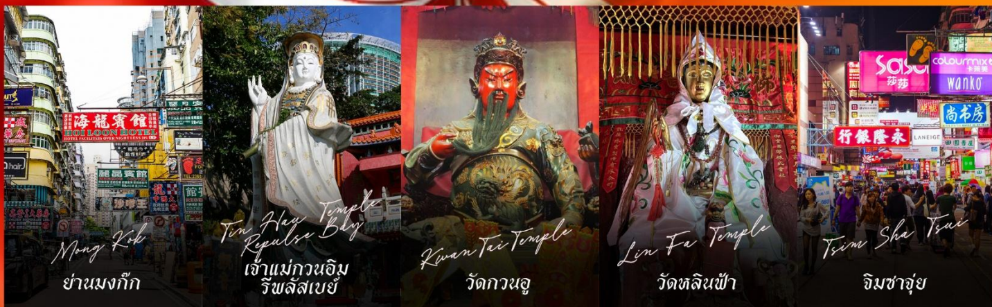
Mong Kok ย่านมงก๊ก

รายการทัวร์ข้างต้นอาจมีการปรับเปลี่ยนเพื่อความเหมาะสม