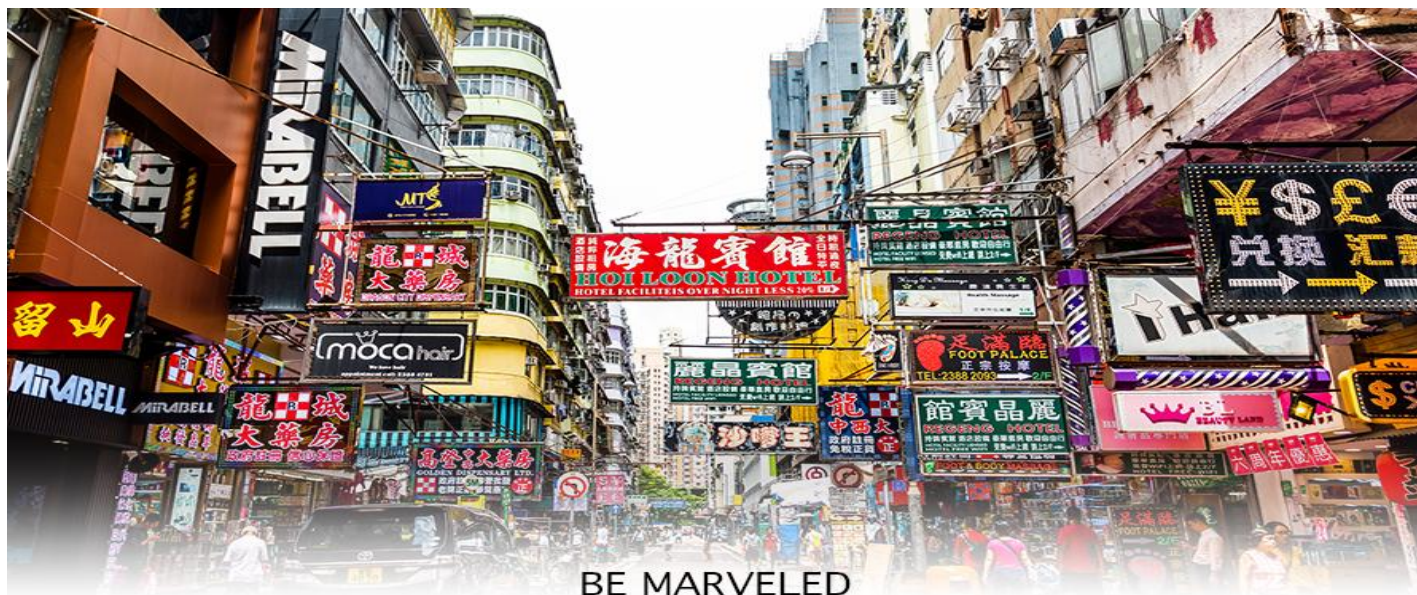
BE MARVELED MONGKOK

เมืองฮ่องกง ตัวสะพานชั้นบนจะเป็นทางให้รถยนต์วิ่ง ส่วนชั้นล่างเป็นเส้นทางของเอ็มทีอาร์ (MTR) และแอร์พอร์ตเอ็กเพรสเทรนส์ (AIRPORT EXPRESS TRAINS) สะพานแขวนชิงหม่านี้ ได้ถูกคัดเลือกให้เป็นสัญลักษณ์ของกรุงทั่วโลกอีกด้วย