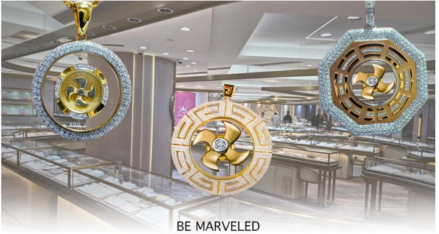
BE MARVELED ศูนย์ฮวงจุ้ย กังหันเศรษฐี

นำท่านชม ศูนย์ฮวงจุ้ย กังหันเศรษฐี ที่ขึ้นชื่อของฮ่องกง ท่านจะได้พบกับงานดีไซน์ที่ได้รับรางวัลยอดเยี่ยม และใช้ในการเสริมดวงเรื่องฮวงจุ้ย โดยการย่อใบพัดของกังหันที่เป็นสัญลักษณ์ของวัดวัดเข่งหมิว มาทำเป็นเครื่องประดับ ไม่ว่าจะเป็น จี้, แหวน, กำไล หรือต่างหูเพื่อเป็นเครื่องประดับติดตัว และเสริมดวงชะตา ซึ่งสินค้าทุกชิ้น มีเอกสาร รับประกันคุณภาพเปลี่ยน หรือ ซ่อม ได้ตลอดอายุการใช้งาน หากเกิดการชำรุดจากสินค้าไม่ใช่อุบัติเหตุ