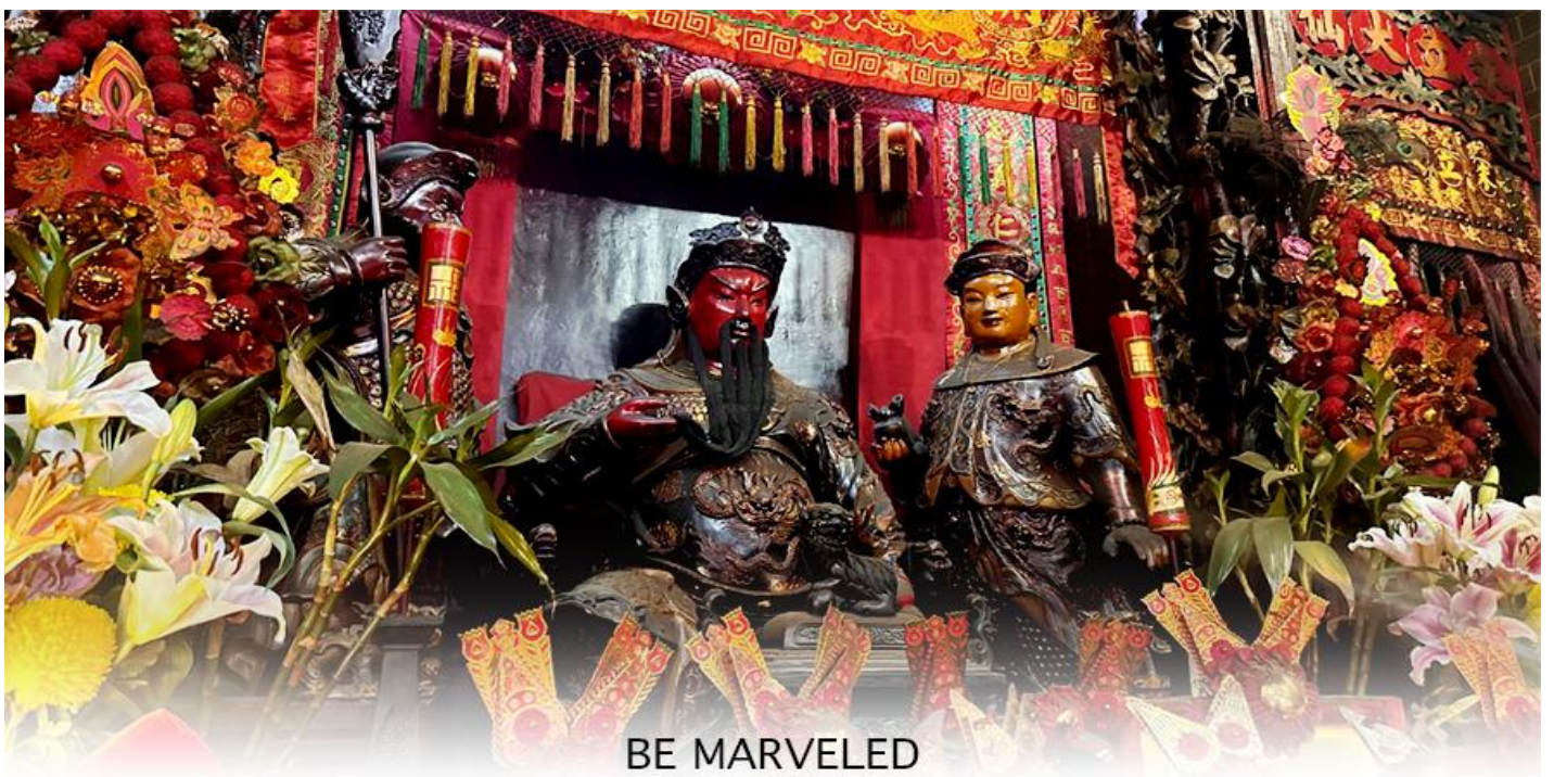
BE MARVELED วัดกวนอู

ท่านเดินทางสู่ วัดกวนไท หรือที่คนไทยนิยมเรียกว่า " วัดเทพเจ้ากวนอู " เป็นสถานศักดิ์สิทธิ์อันเลื่องชื่อ ถือว่าเป็นวัดแห่งเดียวในเขตเกาลูน ที่สร้างขึ้นเพื่อบูชา เทพเจ้ากวนอู ซึ่งท่านเป็นเทพเจ้าแห่งความซื่อสัตย์ เปี่ยมไปด้วยคุณธรรม โดยศาลเจ้าพ่อกวนอูแห่งนี้ ผู้ที่มาไหว้สักการะจะนิยมขอพรเรื่องธุรกิจและบิรวาร เนื่องจากว่าเจ้าพ่อกวนอู เป็นเทพเจ้าที่รักษาคำพูดด้วยชีวิต รักคุณธรรม ซื่อสัตย์ ช่วยปกป้องสิ่งเลวร้าย อันตรายต่าง ๆ และช่วยเสริมอำนาจบารมีในการปกครอง ท่านมีจิตใจมั่นคงตั้งขุนเขา มีสติปัญญาเป็นเลิศ และไม่ประมาท ท่านจึงเป็นสัญลักษณ์แห่งความเข้มแข็งโดดเด่นไม่ครั้นคร้ามต่อศัตรู ฉะนั้นการมาบูชาขอพรท่าน จะช่วยเสริมดวงไม่ให้เพลี่ยงพล้ำแก่ศัตรู ทำให้มีมิตรที่ซื่อสัตย์ และคุ้มครองบิรवारให้ก้าวหน้าและอยู่เย็นเป็นสุข ซึ่งผู้ประกอบอาชีพ ตำรวจ ทหาร และ นักการเมือง จึงมักจะนิยมบูชาเทพเจ้ากวนอู เป็นพิเศษ