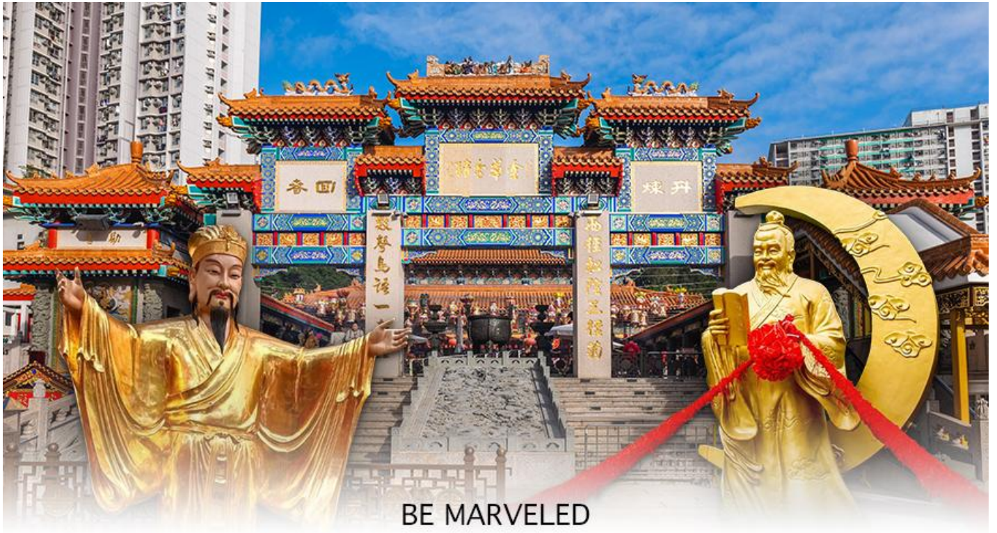
BE MARVELED วัดหวังต้าเซียน

ร่วมเย็นเป็นสุข ซึ่งจะปรากฏตัวยามค่ำคืนภายใต้แสงจันทร์ เป็นเทพเจ้าผู้เป็นอมตะที่อาศัยอยู่บนดวงจันทร์ และลงมาโลกมนุษย์ เพื่อผูกค้ายดวงชะตา ระหว่างคู่รักซึ่งเมื่อคู่กันแล้วก็จะไม่แคล้วคลาดกัน และมีความรักที่มั่นคงและยืนยาว