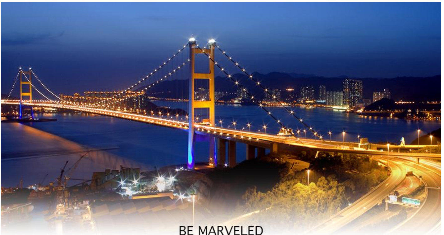
BE MARVELED สะพานแขวนชิงหม่า

17.40 น. เดินทางถึง สนามบินเซ็กแล็บก๊อก (CHEK LAP KOK INTERNATIONAL AIRPORT) เขตปกครองพิเศษฮ่องกง หลังผ่านพิธีการตรวจคนเข้าเมืองเป็นที่เรียบร้อยแล้ว รับกระเป๋าสัมภาระ เดินทางโดยรถโค้ชปรับอากาศ (เวลาที่ท้องถิ่นที่ฮ่องกง เร็วกว่าประเทศไทย 1 ชั่วโมง)