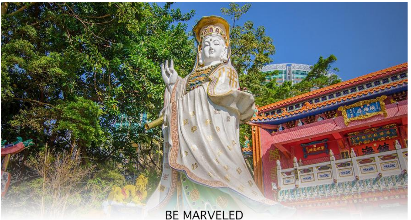
BE MARVELED วัดเจ้าแม่กวนอิมรีพัลส์เบย์

จากนั้นนำท่านเดินทางสู่ ชายหาดรีพัลส์ เบย์ (REPULSE BAY) หาดทรายรูปจันทร์เสี้ยวแห่งนี้เป็นหาดที่สวยงามที่สุดแห่งหนึ่งในฮ่องกง และยังใช้เป็นฉากในการถ่ายทำภาพยนตร์หลายเรื่อง ถือเป็นแหล่งท่องเที่ยวยอดนิยมในหมู่ชาวฮ่องกง นักท่องเที่ยวที่นิยมมาสักการะที่ วัดทินฮั่ว อ่าวรีพัลส์เบย์ (TIN HAU TEMPLE REPULSE BAY) ซึ่งตั้งอยู่ริมทะเล เป็นสถานที่ท่องเที่ยวสำคัญ สร้างขึ้นในปี ค.ศ.1993 มีรูปปั้นของ เจ้าแม่กวนอิม ปางประทานพรตั้งอยู่ ซึ่งคนฮ่องกงและคนจีนให้ความเคารพนับถือมากที่สุด เชื่อว่าเป็นเทพที่มีความศักดิ์มากขอพรเรื่องงานการเงิน และขอพรขอโชคลาภเพื่อเป็นสิริมงคล และขอพร