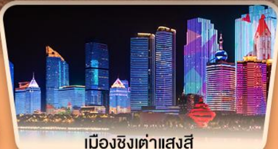
เมืองชิงเต่า 11 แสงสี