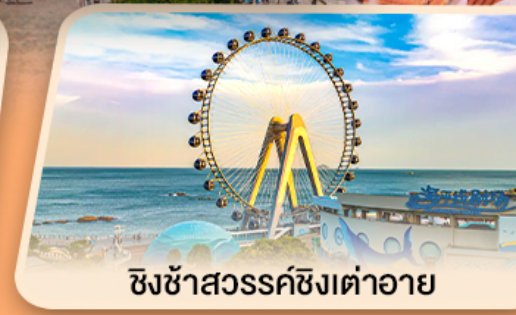
ชิงช้าสวรรค์ซิงต้าอาย