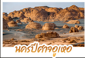
นครปีศาจอูเออ

หนาวนี้ที่ซินเจียง เราจะลิ้มรสความงามสุดอลังการของอุทยานคานาสี เก็บภาพสวยครบทุกพิกัด ทั้งศาลาชมปลา อ่าวสีเขียวจินรา อ่าวซ่อนมิงกร และอ่าวเทพทวดคา • นอนพักค้างคืนในกระท่อมไม้ ภายในหมู่บ้านเหมอู๋ ตื่นเช้ามาสูดอากาศบริสุทธิ์และจับจุดชมวิวนูบ้านที่ถูกหิมะปกคลุมราวกับเมืองในฝัน นั่งรถไฟขบวนวินคริปัสจ้อเหอ • ช้อปปิ้งของฝากที่ตลาดแกรนด์บาซาร์ เมืองอู่ลูบูฉี