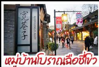
หมู่บ้านโบราณฉือซีไห่