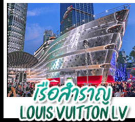
เรือสำราญ LOUIS VUITTON LV