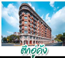
ตึกอู่กิง

หอไข่มุก - เทาหนิวโล่งซาน - วัดพระใหญ่หลิงซานต้าฝอ เรือสำราญ LOUIS VUITTON LV - ตึกอู่กิง รถไฟเล็กป่าไผ่หมู่บ้านหยาศู - หมู่บ้านเหนียนฮวาวาน