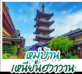
หมู่บ้าน เหนียนฮวาวาน