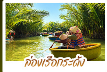
ล่องเรือกระดาน้ำ