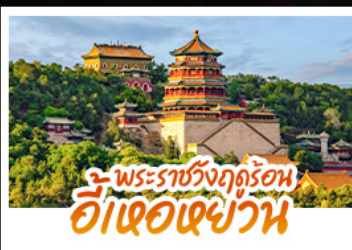
พระราชวังฤดูร้อน ฮ้อเจอเฉวหน