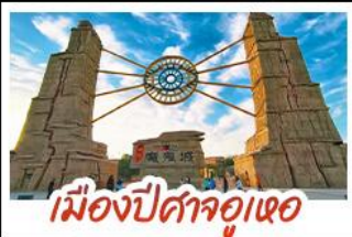
เมืองปีศาจอุเออ