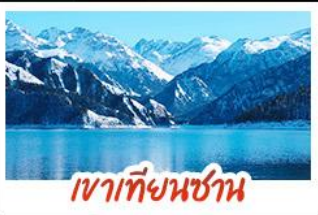
เขาเทียนชาน