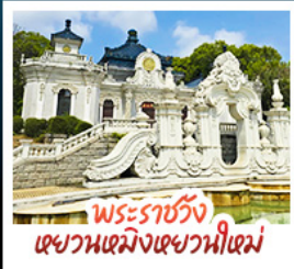
พระราชวัง เฉวียนเหมิงเฉวียนใหม่