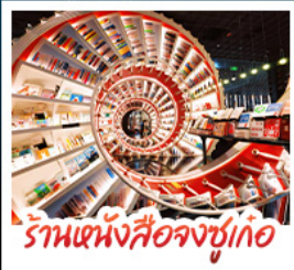
ร้านหนังสือจุงชูก่อ