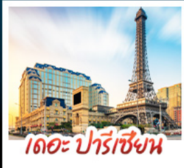
เดอะ ปารีสเซียน

สัมผัสบรรยากาศ เดอะ เวนเซียน มาเก๊า เสมือนได้เยือนลาสเวกัส ชมความวิจิตรตระการตาของพระราชวังหยวนหมิงหยวนใหม่แห่งจูไห่ เช็กอินกับแลนด์มาร์กสุดฮิตจตุรัสสวาเอ็งถ่ายรูปลูกบ่อทีวีของกวางเจา เที่ยวชมหมู่บ้านสไตล์ยุโรปแห่งใหม่ของเซินเจิน • ช้อปปิ้งเพลิน ๆ ที่ ห้างสรรพสินค้า COCO PARK ถนนคนเดินฟู้หว่หลี่และถนนคนเดินปิกกิง