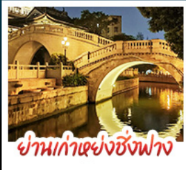
ย่านเก่าแห่งซิงฟาง