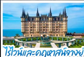
ไร่ไวน์และคฤหาสน์จางยู