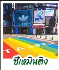
ซีเหมินดิง

สัมผัสเสน่ห์แห่งเกาะฟอร์โมซา • ล่องเรือสุริยันจันทร์ ทะเลสาบที่สวยงามแห่งหนึ่งของไต้หวัน เกาะลาลู • วัดเหวินอู๋ วัดศักดิ์สิทธิ์ริมทะเลสาบ • สักการะพระอัฐิพระกั๊กซิมจิ้ง • ชิมขนมพาย้อิบโปรด ของฝากยอดนิยม • อนุสรณ์สถานเจียงไคเช็ค แลนด์มาร์กทางประวัติศาสตร์ • ชิเหมินดิง ยำบั้งโป่งสุกฮิด จิวเฟิ่น หมู่บ้านโบราณโคมแดง บรรยากาศสุดคลาสสิก • ลีอูเฟิ่น ปล่อยโคมลอย • ไทเป 101 ตึกระฟ้า สัญลักษณ์แห่งความทันสมัย • จงชาน ย่านคาเฟ่และไลฟ์สไตล์สุดฮิต • วัดหลงชาน วัดเก่าแก่ เสริมสิริมงคล