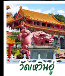
วัดเหวินอู๋