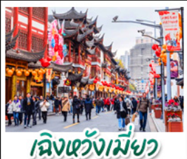
เมืองเฉิงเหมียว