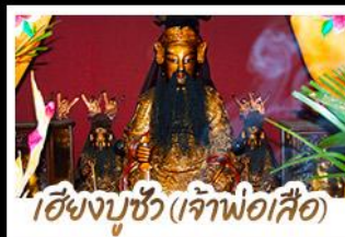
ไฉ่ซิงบูซู่ (เจ้าพ่อเสือ)