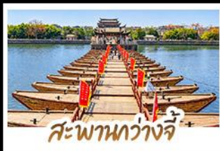
สะพานว้างจี