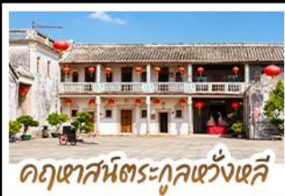
คฤหาสน์ตระกูลหวังเฉี