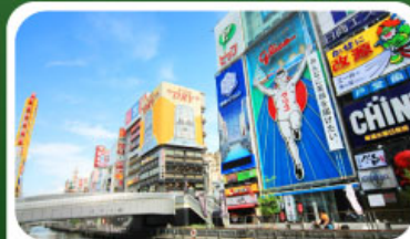
ช้อปปิ้งย่านชินโจบาชิ