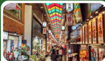
ตลาดปลาชิซึกิ