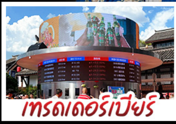
เทรตเตอร์เบียร์