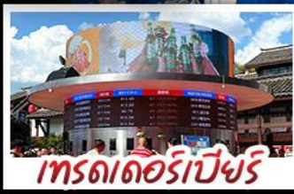
เทรดเดอร์เบียร์