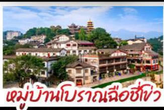
หมู่บ้านโบราณถ้อซื่อโจ้ว

พระแกะสลักหินต่างู๋ - ตึกตะเกียบ Raffles City - ตึกชยุซิง เทรดเดอร์เบียร์ - หมู่บ้านโบราณถ้อซื่อโจ้ว