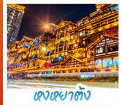
แสงเซาตัง

อุทยานหลุมฟ้าสะพานสวรรค์ • อุทยานเขานางฟ้า • หงหยาดัง • ดิกยอชิง ชั้น 22 • วัดต้าจื่อ ชมรถไฟอะลูมิเนียม • สะพานโบราณหนานเฉียว • เมืองโบราณกวมเชียน • อุทยานภูเขาสี่ดรุณี อุทยานต้ากู่ปิงชวาน • จดรัสหยางเทียนหู่ • รูปปั้นหมี่เฟินด้านอมเซลฟี • ร้านหนังสือจุกเทอ ถนนคนเดินซุนซื่อ • หมี่แพนด้าปิ่นดัก IFS • ถนนไถ่กู้หลี่ • ถนนโบราณชอยกว้างชอยแคบ