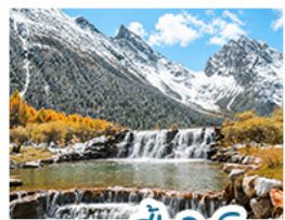
อุทยานน้ำแฉิงโกว