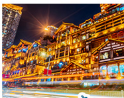
แสงอาคารตั้ง

อุทยานหลุมฟ้าสะพานสวรรค์ • อุทยานเขานางฟ้า • หงหยาดัง • ตึกพูยจิง ชั้น 22 • วัดต้าอือ ชมรถไฟทะเลสาบ • สะพานโบราณหนานเฉียว • เมืองโบราณกวนเซียน • อุทยานภูเขาสีดรุณี อุทยานตำกูปิงชาน • จตุรัสหยางเทียนหวู่ • รูปปั้นหมีแพนด้าอนเซลฟี • ร้านหมิงซือจิงซูเก้อ ถนนคนเดินซุนซีลู่ • หมีแพนด้าปีนตึก IFS • ถนนไม้กู่หลี่ • ถนนโบราณชอยกว้างชอยแคบ