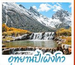
อุทยานปีผิงโกว