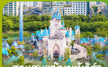
สวนสแกนดิเนเวียเวิร์ล Lotte Adventure World