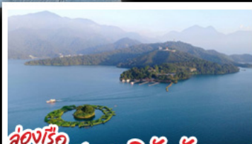
ล่องเรือทะเลสาบสุริยัมจินตรา