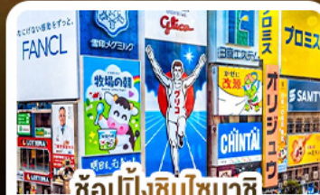
ซ้อปั้งชินโซบาชิ และโดตงโมริ