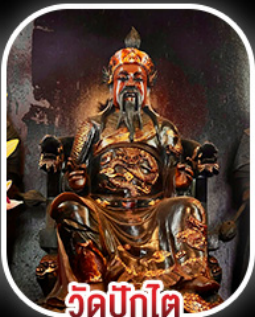
วัดปิกไค