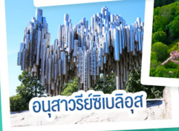
อนุสาวรีย์ซีเบลึส