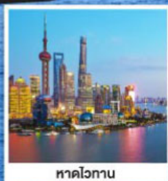
หาดไว่กาน