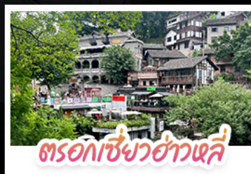
ตรอกเซี่ยวฮ่าวเสี