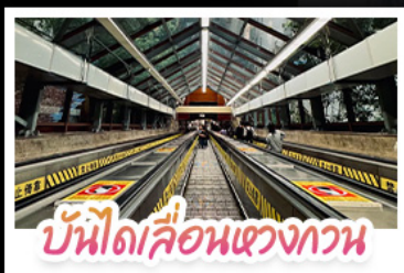
บันไดเลื่อนดวงกวน