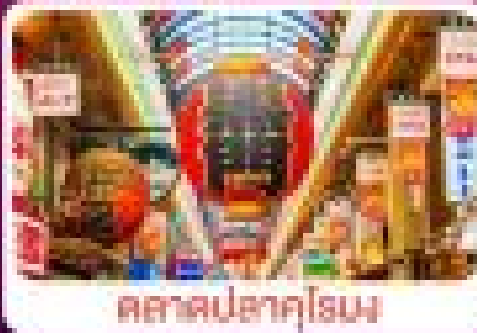
ตลาดปลาคูโรเม