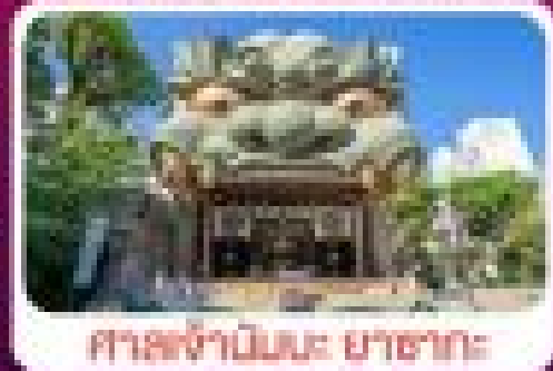
ศาลเจ้าอินบะ ยาชางะ