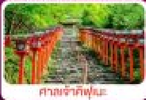
ศาลเจ้าฟูชิมิ