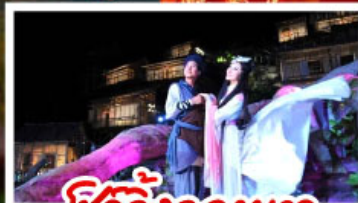
ชีวิตจิ้งจอกขาว