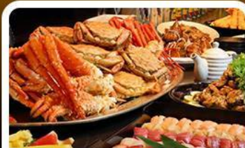
บุฟเฟ่ต์ซาซิมิ+ชาบู 3 ชนิด