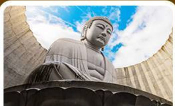
เนินเขาแห่งพระพุทธรเจ้า