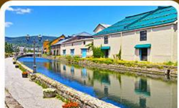
คลองไอตารุ