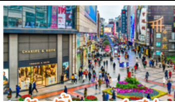
ซ้อปึงกนบนซุนซี้ลู่