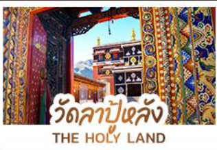
วัดลาปูหลง THE HOLY LAND

หนึ่งศรัทธา: สัมผัสความสงบและสถาปัตยกรรมทิเบตที่ วัดลาปูหลง หนึ่งผืนหญ้า: ล่องลอยไปในความเขียวจี๋อง กุ้งหญ้ากานหนาน หนึ่งสายน้ำ: ค้นพบความงามเหนือกาลเวลาที่ จิวจ้ายโกว