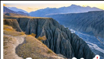
แกรนด์แคนยอนตุ่ซ่านจื่อ

ทะเลสาบโซหลี่มู่ - คานาสี แกรนด์แคนยอนตุ่ซ่านจื่อ ตลาดแกรนด์บาซาร์ - หมู่บ้านเหม่อมู่