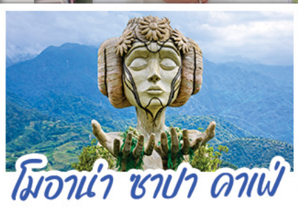
ไมอาน่า ซาปา ดาเฟ