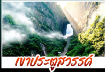
เขาประตูสวรรค์