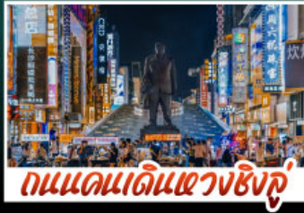
ถนนแดนแดนเซี่ยงชู่