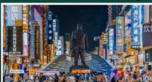
ถนนแดนดินแดงซิงกู่