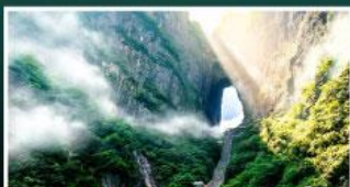
เขาประตูลีซาน