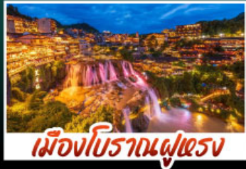
เมืองโบราณผู่เฉว่ง