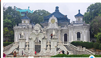
พระราชวังเฉวหนเหมิงเฉวหนิใหม่