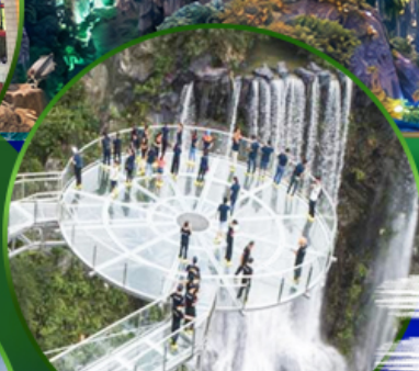
สะพานแก้วคู่หลงเซี่ยะ