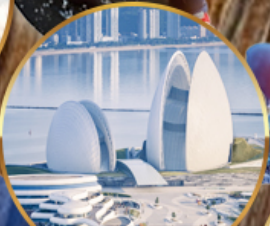
โรงแรมหรูไฮ้มุก