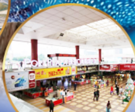
ตลาดกึ่งเปย์