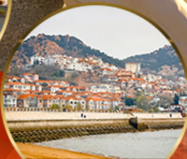
ซาจื่อโข่