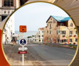
ถนนฮ่าวจี้ปา