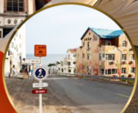
ถนนอ่าววีป่า