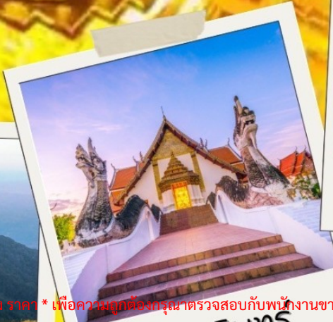
วัดถ้ำมึนทร์