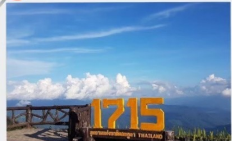
จุดชมวิวที่มีความสูง 1715