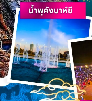
น้ำพุคังบาห้ซี