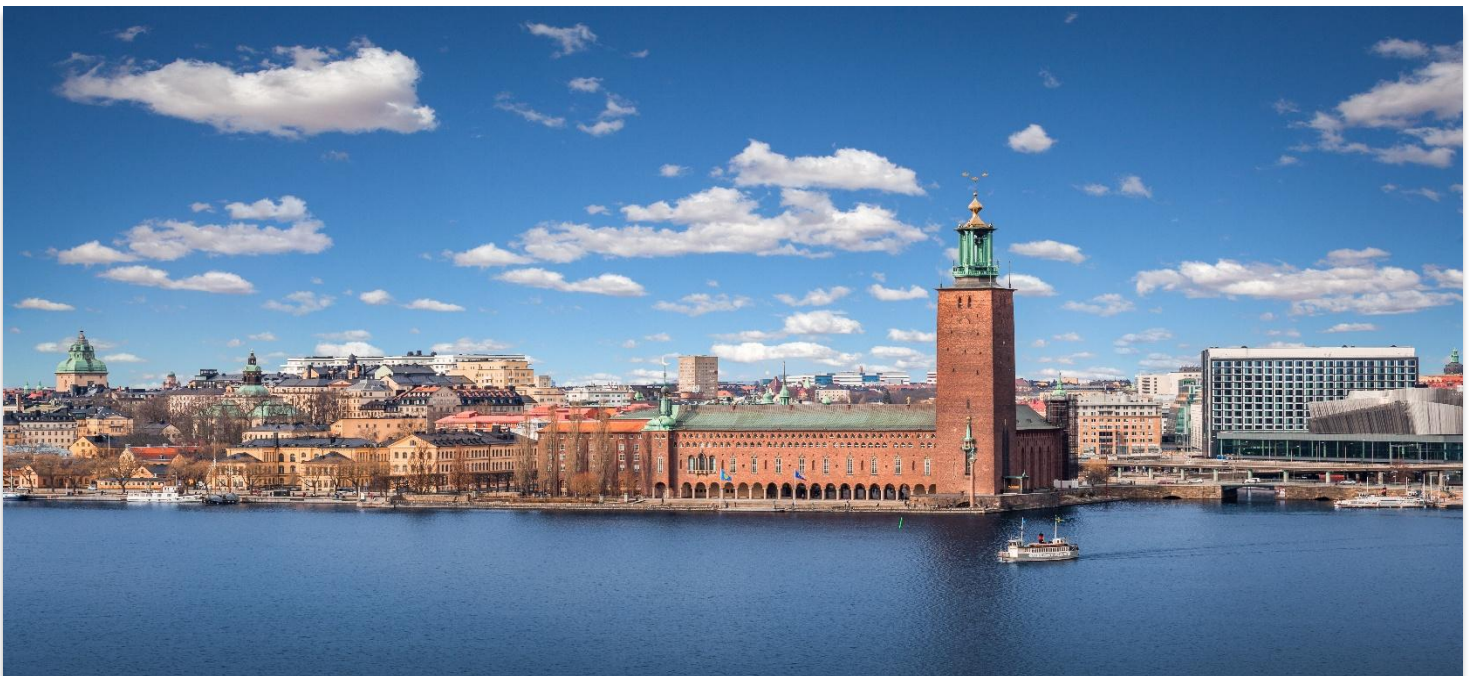
STOCKHOLM CITY HALL