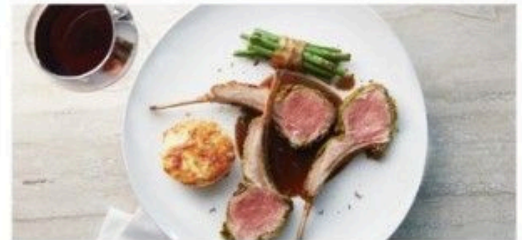
The Haven Restaurant