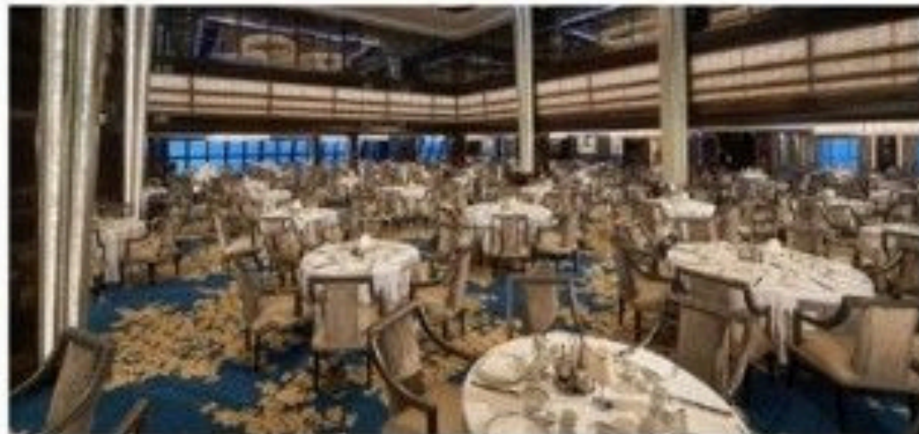
The Manhattan Room