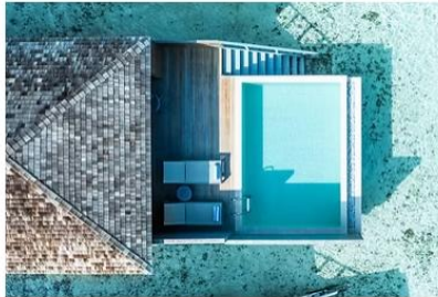
Dheru Water Villa