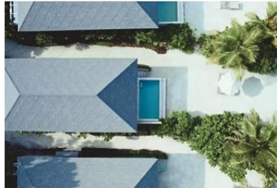
Dheru Beach Pool Villa