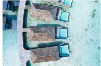
Mabin Water Pool Villa