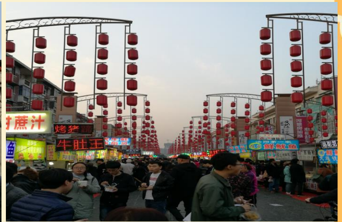
ค่ำ 📍 บริการอาหารค่ำ ณ ภัตตาคาร ที่พัก REZEN HOTEL ระดับ 4 ดาว หรือเทียบเท่า