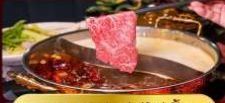
ชาบูหม่าล่าไม้อัน