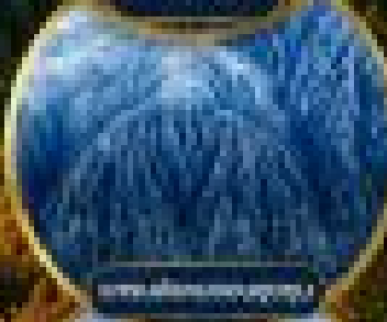
ธารน้ำร้อนเมืองตงตง