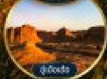
หมู่บ้านห่าว