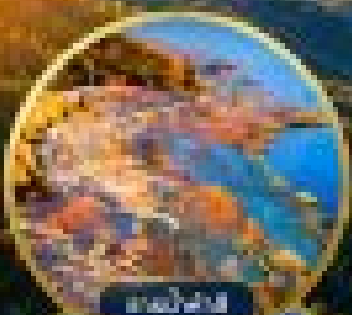
ธารน้ำฟ้าสี