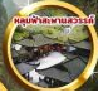
หมู่บ้านทะเลสาบฉู่หล่ง