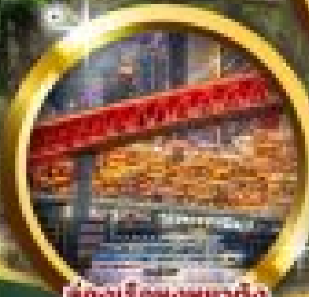
ต้องเรื่องหงฮ่าฉิ่ง