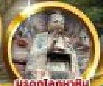
มังกรโลกมหาศิม แกะสลักฉ่าจู้