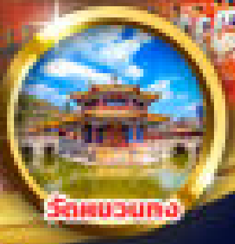
วัดชวงมถง