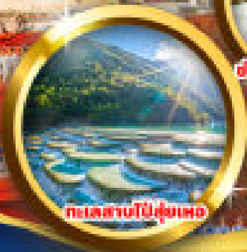
ทะเลสาบป๋าย่่มเหอ