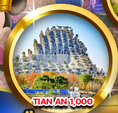
TIAN AN 1,000