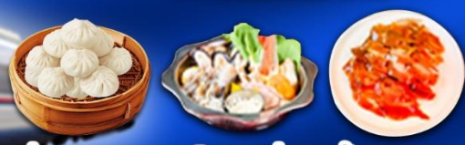
เสี่ยวหลงเปา+เปิดปักกิ่ง+สุกิมองโกล